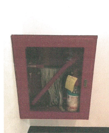
ตู้อุปกรณ์ดับเพลิง