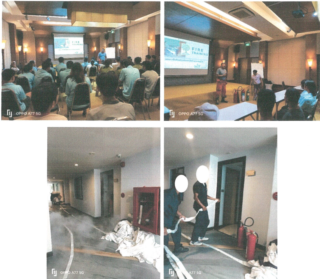
รูปภาพที่ 2.10 การซ้อมอพยพหนีไฟ