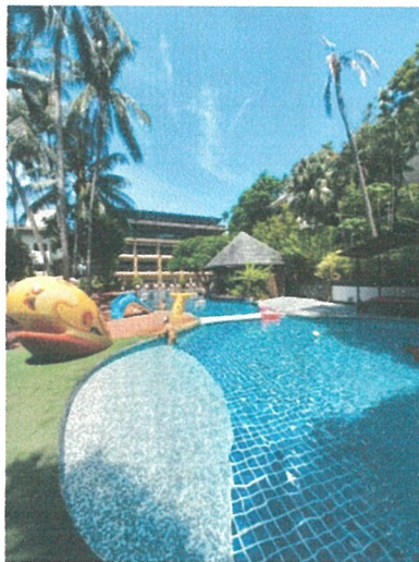
รูปภาพที่ 2.5 สระว่ายน้ำโครงการ