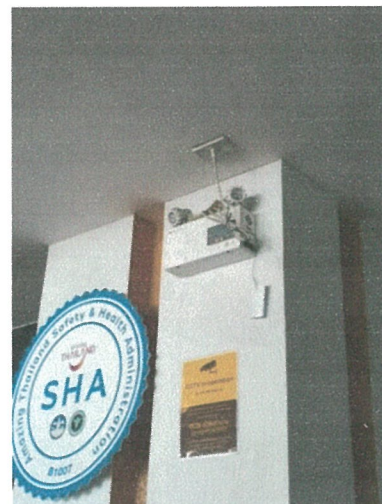
ไฟฉุกเฉิน