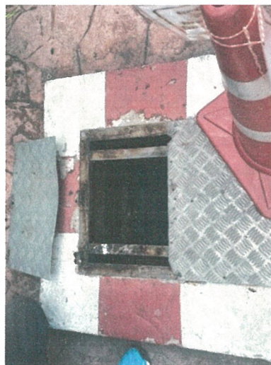
รูปภาพที่ 2.6 ถึงเก็บน้ำดิบสำรอง