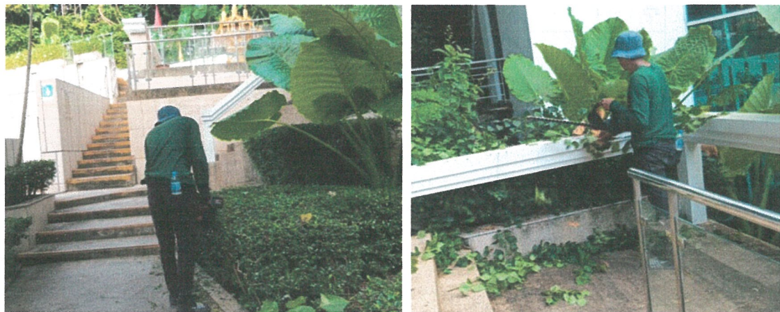
รูปภาพที่ 2.2 งานดูแลสวน