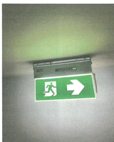
ป้ายทางหนีไฟ