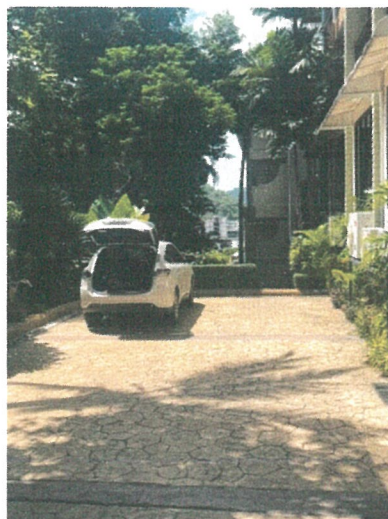
รูปภาพที่ 2.3 พื้นที่สำหรับจอดรถ