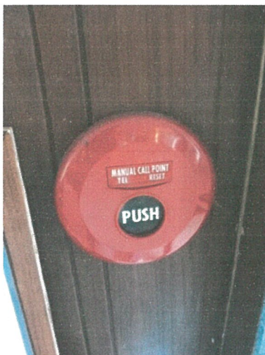
อุปกรณ์แจ้งเหตุด้วยมือ