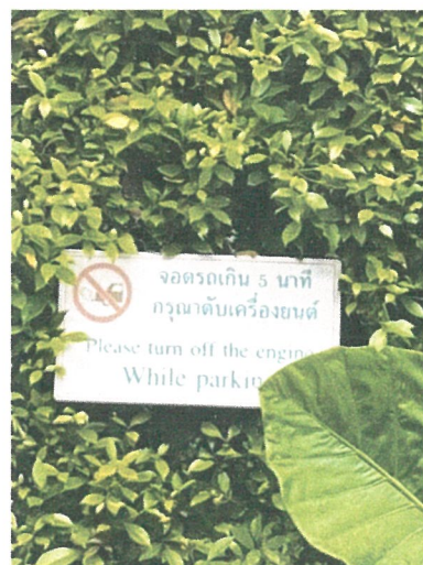
รูปภาพที่ 2.12 ป้ายดับเครื่องยนต์