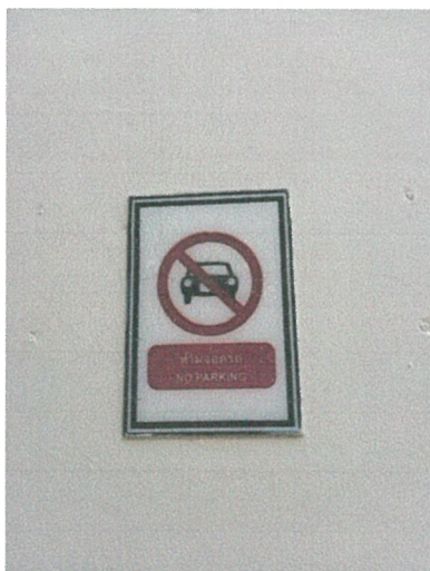
รูปภาพที่ 2.11 ป้ายห้ามจอดรถ