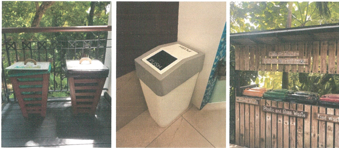
รูปภาพที่ 2.4 ถึงขยะภายในโครงการ