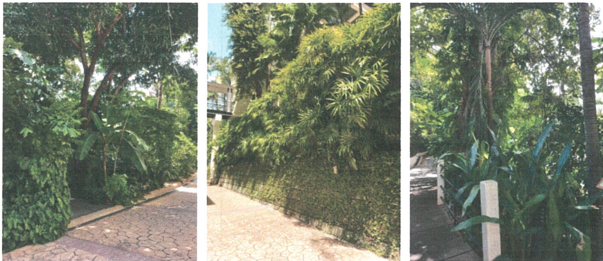
รูปภาพที่ 2.1 พื้นที่สีเขียวภายในโครงการ