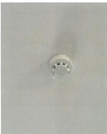
อุปกรณ์ตรวจจับควัน