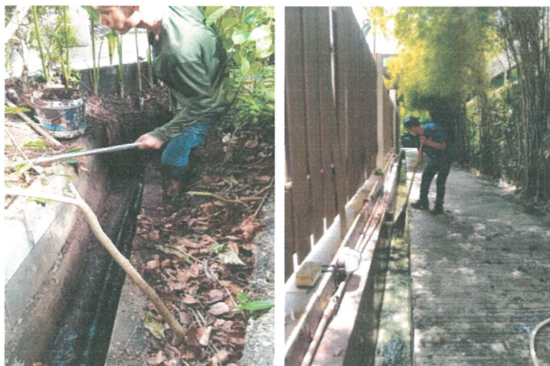
รูปภาพที่ 2.7 การขุดลอกตะกอน