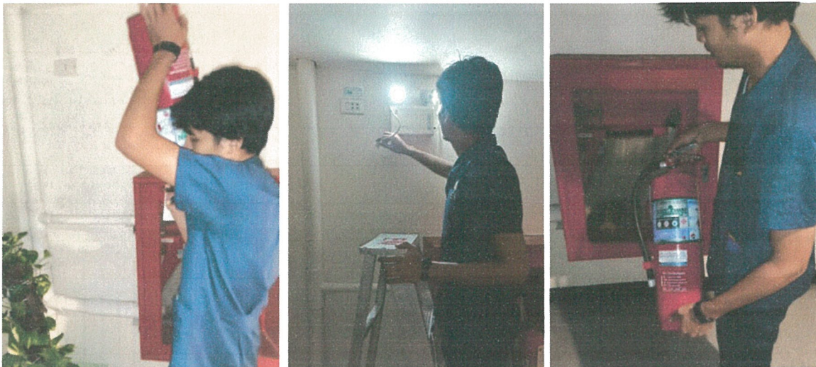
รูปภาพที่ 2.8 การตรวจสอบอุปกรณ์ป้องกันและแจ้งเตือนอัคคีภัย